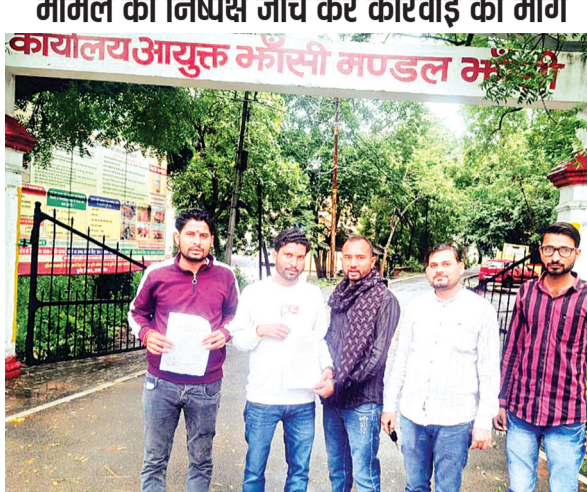
हरिभूमि न्यूज़ ललितपुर

बानपुर मार्ग स्थित विकास खंड बार परिसर में बेशकीमती सरकारी जमीन पर निर्माण का उल्लंघन कर बीस दुकानों के निर्माण को अवैध बताते हुये भ्रष्टाचार को बढ़ावा देने का आरोप ब्लाक प्रमुख पर लगाया गया है। इस सम्बन्ध में गत दिवस ग्रामीणों ने लामबंद होकर डीएम को शिकायती पत्र दिया था। लेकिन तीस अक्टूबर गुरुवार को झांसी मण्डल आयुक्त कार्यालय पहुंच कर शिकायती पत्र सौंपा है। ज्ञापन में ब्लाक प्रमुख पर करोड़ों रुपये के घोटाले किये जाने का आरोप लगाते हुये जांच कराये जाने की मांग उठायी गयी है। ज्ञापन में बताया कि विकास खण्ड बार परिसर में बार-बानपुर रोड किनारे करोड़ों की बेशकीमती जमीन पर पंचायती राज एक्ट 1961 एवं शासन के निर्देशानुसार क्षेत्र पंचायत व जिला पंचायत द्वारा दुकानें भवन आदि का निर्माण शासन की अनुमति के बिना नहीं