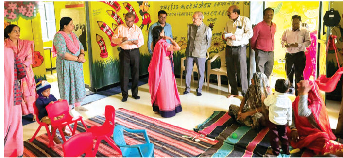
नलखेड़ा