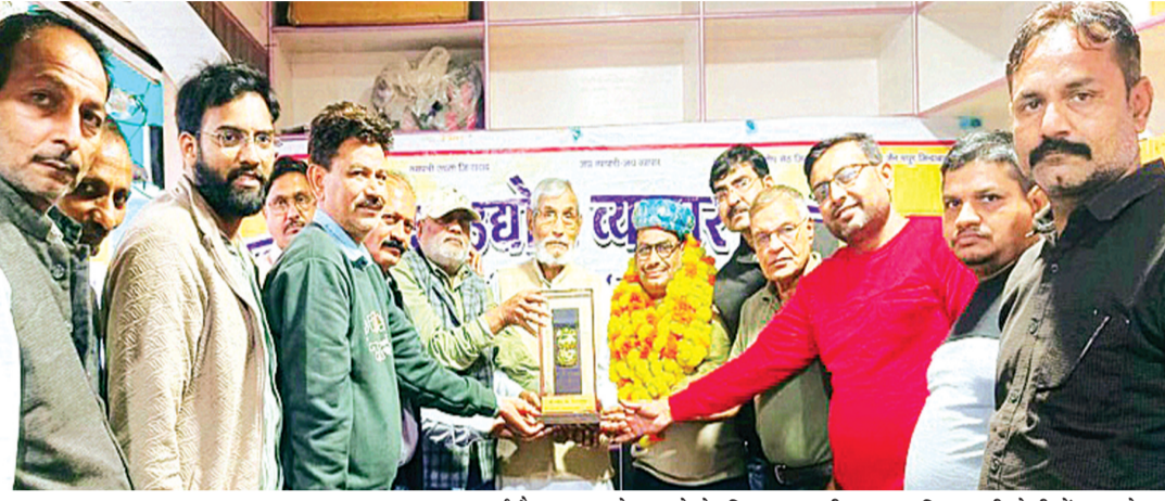
हरिभूमि न्यूज़ ललितपुर